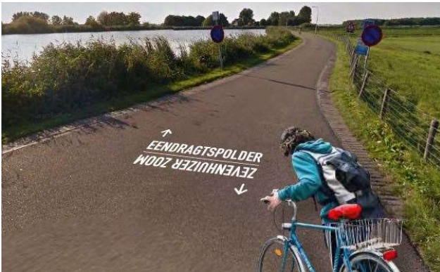
Figuur 2 Visualisatie wegmarkering

Op een aantal plekken waar borden landschappelijk niet gewenst zijn, worden wegmarkeringen aangebracht voor fietsers (zie figuur 2). Zo weten zij dat ze van het ene deelgebied naar het andere gaan. In enkele gevallen zal er bij een secundaire entree naar het recreatiegebied ook een wegmarkering worden aangebracht.